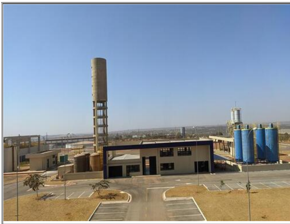
Foto 1 - Estação de Tratamento de Água Corumbá

A operação da ETA ainda não está ocorrendo de forma ininterrupta, pois, de acordo com o que a Caesb reportou na reunião do dia 15/08/2022 (93542571), a Saneago, responsável pela operação do sistema, dispõe no momento de pessoal suficiente apenas para 12 horas diárias.