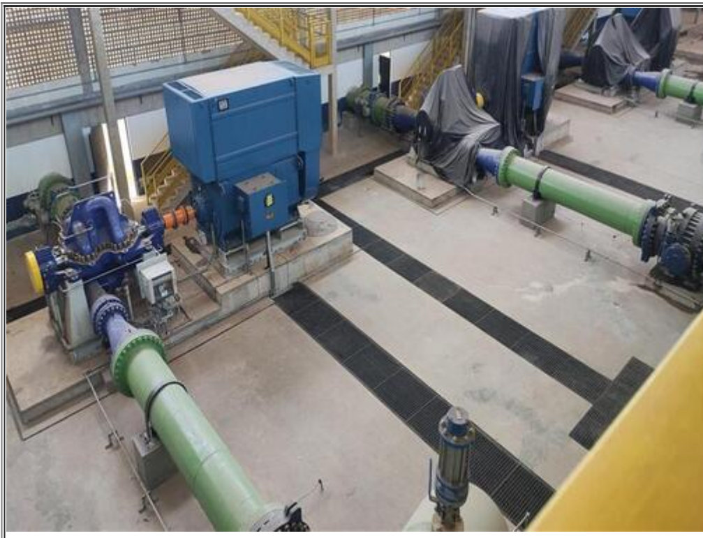
Foto 8 - Motores da Estação Elevatória de Água Tratada