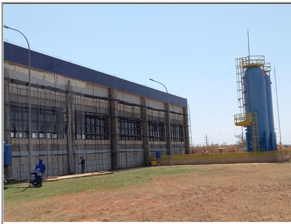
Foto 3 - Pintura da Elevatória de Água Tratada

Estavam em execução na ETA a pintura da Elevatória de Água Tratada (Foto 3) e instalação de defletores nos flutuadores.