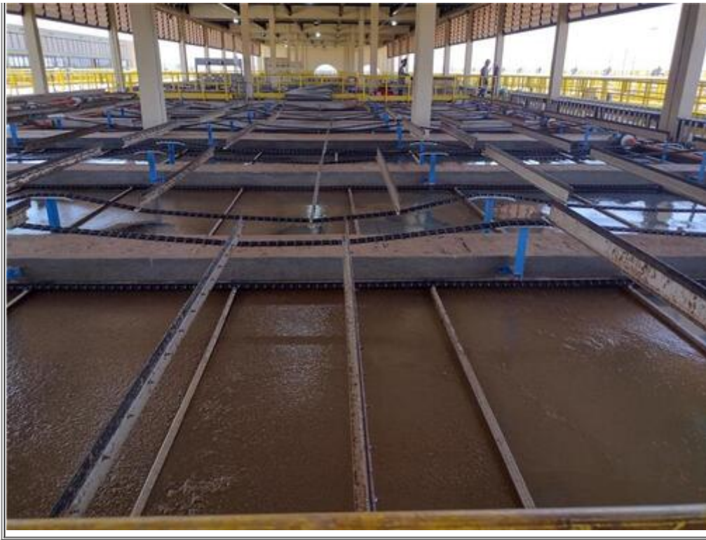
Foto 7 - Flotadores da ETA Corumbá