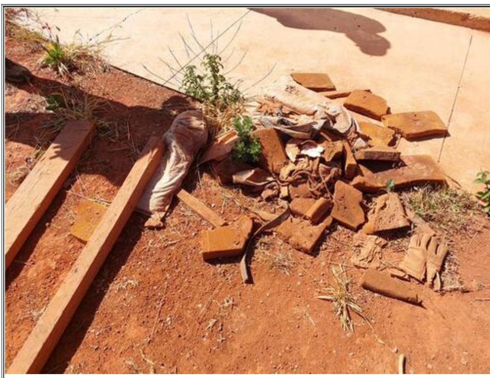
Foto 5 - Amostra de objetos retirados da adutora de água tratada durante limpeza