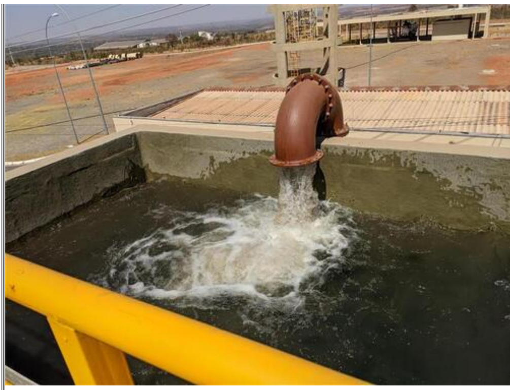
Foto 2 - Entrada de água bruta na ETA e de água de recirculação da lavagem dos filtros

A água tratada na ETA deve ser bombeada para as RAs Riacho Fundo II, Santa Maria, Recanto das Emas, Park Way e Gama. Porém até aquele momento a água não estava sendo distribuída à população, porque havia sido detectada uma grande quantidade de sujeira na adutora de água tratada, remanescente da obra de instalação da tubulação, sendo que toda a água injetada estava sendo utilizada para limpeza.