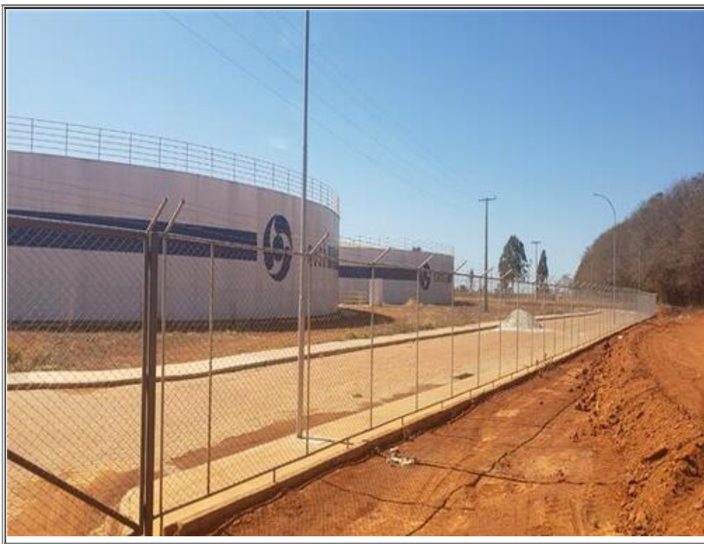
Foto 4 - Reservatório Riacho Fundo II

O reservatório que estava inicialmente recebendo a água da ETA Corumbá (Foto 4) ainda não estava disponibilizando água para consumo, pois a adutora de água tratada ainda não estava completamente limpa. No momento da visita da equipe da Adasa a turbidez da água que estava chegando no reservatório era de 19 NTU, valor acima do padrão de potabilidade exigido. Na unidade está sendo executada a instalação de equipamentos para transmissão dos dados de nível do reservatório e de qualidade da água.