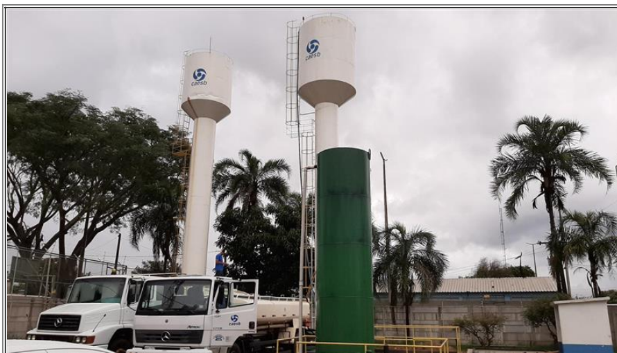
Foto 4 - Abastecimento por caminhão-pipa das caixas d'água da ETA Engenho das Lajes

Na tentativa de regularizar o nível dos reservatórios, desde o dia 26/02/2020 são enviados caminhões-pipa para a estação (em média 9 por dia) (Foto 4).