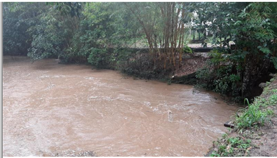
Foto 3 - Córrego Engenho das Lajes

Na tentativa de regularizar o nível dos reservatórios, desde o dia 26/02/2020 são enviados caminhões-pipa para a estação (em média 9 por dia) (Foto 4).