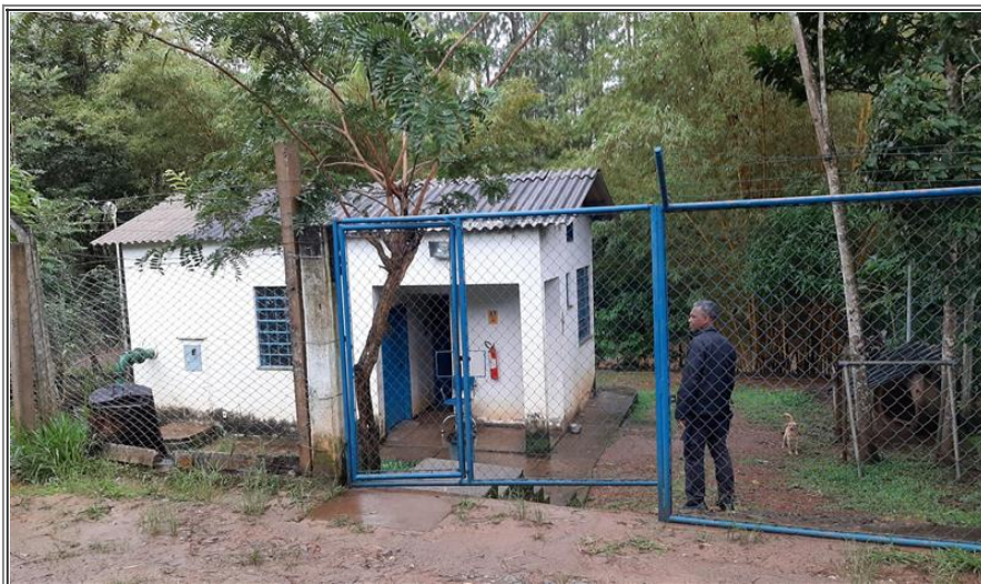
Foto 2 - Estação Elevatória Engenho das Lajes

Os técnicos da Caesb que acompanharam a equipe de fiscalização informaram que nos últimos dias a turbidez da água bruta, de valor usual de 20 NTU, aumentou consideravelmente, chegando a picos de 4.000 NTU, situação não verificada em anos anteriores. De acordo com eles, a estação não trata água de modo efetivo em tais condições, uma vez que com a turbidez alta a lavagem do filtro, usualmente realizada a cada 16 horas, passa a ser realizada a cada 4 ou 6 horas. Dessa forma a ETA fica mais tempo inoperante e gasta maior quantidade de água já tratada na limpeza dos filtros, prejudicando assim o abastecimento da população. Outra informação repassada pelos técnicos da Caesb foi a de que observaram uma elevação no consumo de água nos últimos dias, principalmente durante a madrugada com vazões de até 8,5 L/s, superior à capacidade de produção normal da ETA.