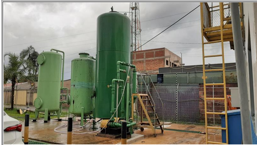
Foto 1 - Estação de Tratamento de Água Engenho das Lajes