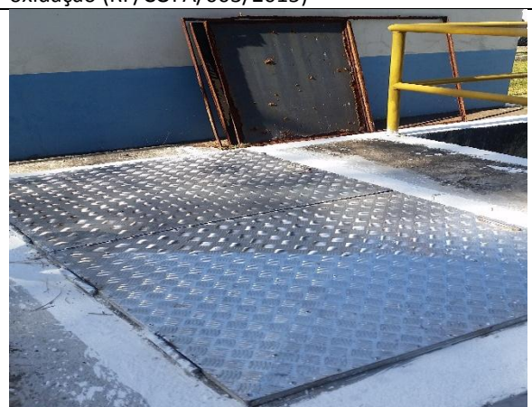
Foto 4 – Tampas antigas do poço de sucção ao fundo e novas placas de inox instaladas.