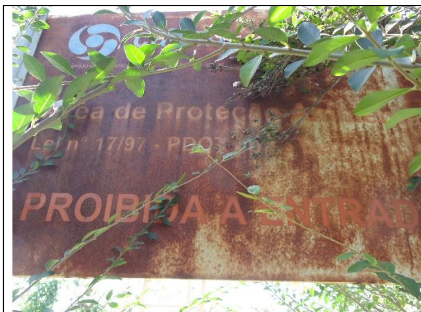
Foto 5 – Placa de advertência da EEB Sobradinho II (RF/COFA/003/2015)

A placa de advertência da Elevatória foi substituída e as tampas do poço de sucção que estavam oxidadas foram substituídas por novas tampas novas de alumínio com reforço de inox nas laterais.