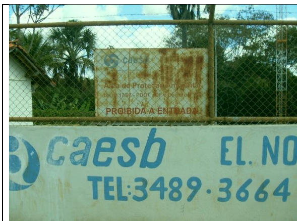
Foto 9 – Placa de advertência da EEB Norte Planaltina (RF/COFA/003/2015)

A placa de advertência da Elevatória foi substituída e as tampas do poço de sucção que estavam em processo de oxidação foram recuperadas.