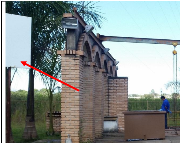
Foto 13 – Placa de advertência da EEB Mestre D'Armas em branco (RF/COFA/003/2015)

A placa de advertência da Elevatória que estava em branco foi substituída, as tampas do poço de sucção que estavam oxidadas foram substituídas por tampas de alumínio com reforço de inox nas laterais e os exaustores que estavam fora de operação foram substituídos e estão em funcionamento.