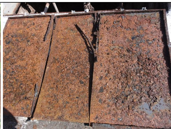
Foto 6 – Tampa do poço de sucção da EEB Sobradinho II (RF/COFA/003/2015)