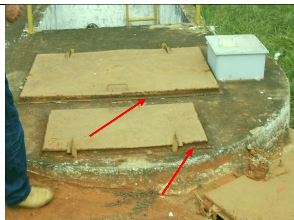
Foto 10 – Tampas do poço de sucção oxidadas nas laterais (RF/COFA/003/2015)