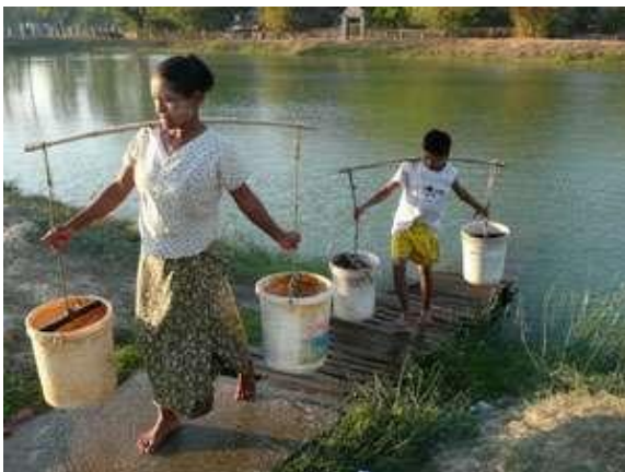
Criança ajuda mãe a retirar água de lago em Yangon, Mianmar.

As doenças diarreicas poderiam ser praticamente eliminadas se houvesse esse esforço, principalmente nos países em desenvolvimento, segundo o levantamento. Esse tipo de doença, geralmente relacionada à ingestão de água contaminada, mata 1,5 milhão de pessoas anualmente.