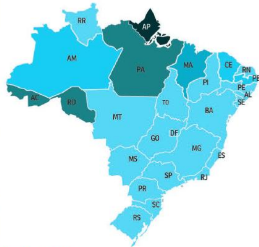
Minervino Junior/CB/D.A Press