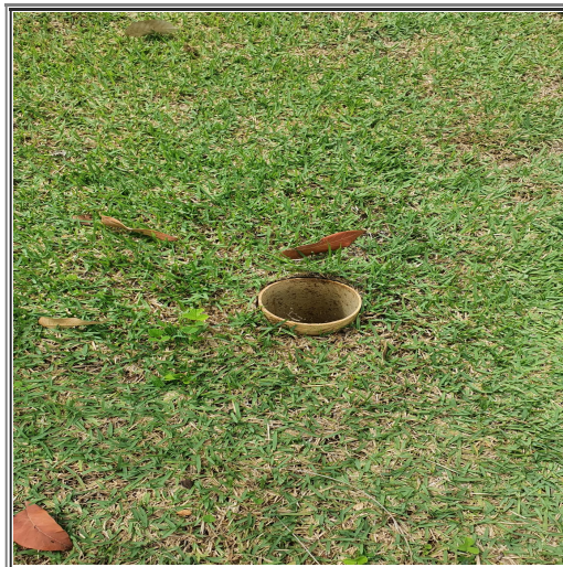
Figura 2 - Til - Dispositivo de acesso à rede de esgoto para manutenção

6.6. Após a apresentação do mapa levou a equipe a algumas ruas do condomínio e informou que a Caesb ao assumir o sistema de esgoto passou a fazer a manutenção nas áreas comuns. Foi verificado que em grande parte da rede a inspeção e eventuais desobstruções são feitas através de uma abertura na tubulação denominada "til" (Figura 2). De acordo com o Sr. João Cosmo a Caesb está exigindo nas novas conexões de ramais a instalação de caixa de inspeção.