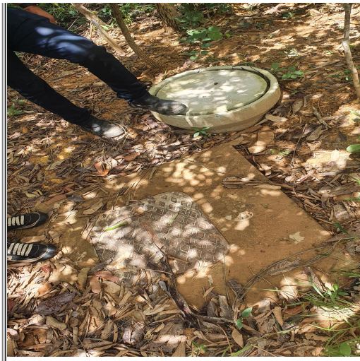
Figura 3 - Caixa de inspeção - Ramal de ligação da residência Sr. Lamberto

6.8. De acordo com o usuário não foi informado, visando confirmar sua anuência à alteração da tarifa de esgoto na fatura de sua residência, que deveria assumir os custos com manutenção no seu ramal de esgoto. Alguns meses após o atendimento à solicitação de alteração na fatura, o usuário e outros moradores do condomínio que já pagavam a tarifa de 60% receberam comunicado da Caesb informando que passariam a pagar a tarifa de 100%.