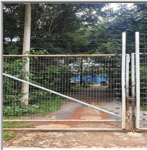
Figura 4 - Estação de tratamento de esgoto do Res. Santa Mônica

6.9. Após a visita à casa do Sr. Lamberti, a equipe foi à estação de tratamento de esgoto implantada no condomínio pelo empreendedor e entregue à Caesb (Figura 4). Atualmente não está operando devido à pouca demanda (aproximadamente 2/3 dos lotes ainda não foram ocupados), e a Caesb apenas retira com caminhão-fossa o esgoto coletado e acumulado na estação.