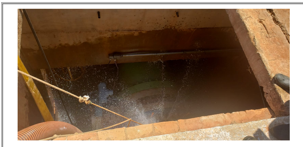
Foto 1 - Vazamento na válvula da adutora