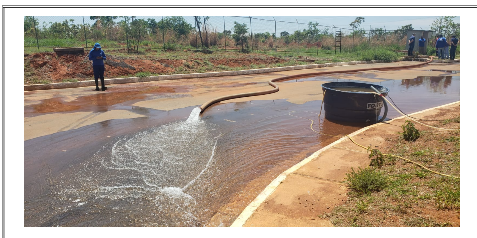
Foto 2 - Esvaziamento da adutora